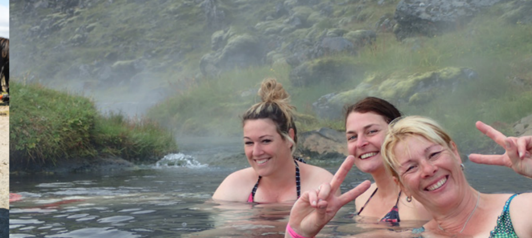
Das Tal Reykjadalur – ein verstecktes Paradies!